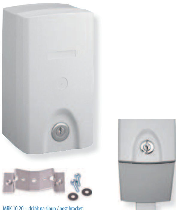
MRK 10,20 – držák na sloup / post bracket