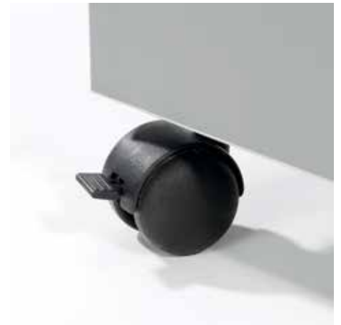
Praktická vodící kolečka pro flexibilní nasazení