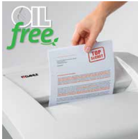
Komfortní skartace bez časově náročného oleje- vání řezných válců